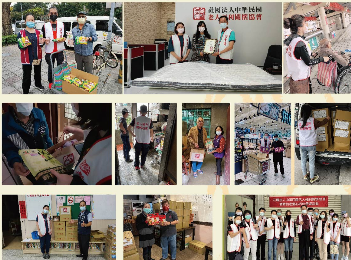
▲ 感謝熱心公益的里長們、志工們、單位、廠商的愛心與協助！